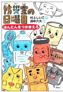
【防災室の日曜日】 村上 しいこ/作 田中 六大/絵