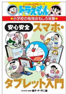
【安心安全 スマホ・タブレット入門】 藤子・F・不二雄