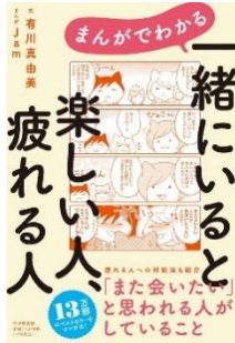
【一緒にいると楽しい人、疲れる人】 有川 真由美/文