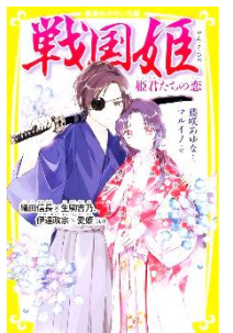
【戦国姫】 藤咲 あゆな/作 マルイノ/絵