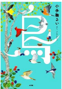
【鳥】 小手鞠 るい/著