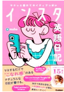
【インスタ英語日記】 maho /著・文