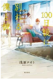
【100日後に別れる僕と彼】 浅原 ナオト/著