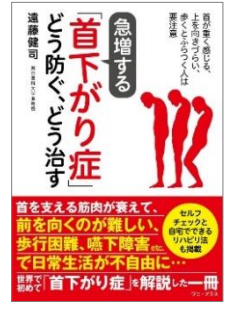
【「首下がり症」どう防ぐ、どう治す】 遠藤 健司/著