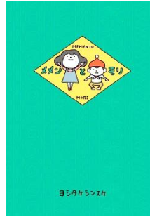
【メンとモリ】 ヨシタケ シンスケ/著