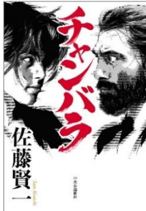
【チャンバラ】 佐藤 賢一/著