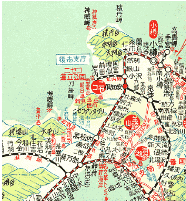
「全国レクリエーション鉄道地図」